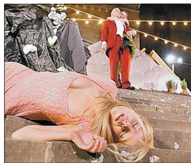
Das tödliche Finale naht: Julia hat Gift geschluckt.

Ich über das Du zu definieren, die zu lernen beginnt, ihren Horizont durch Mitgefühl und Liebe zu erweitern. Das ist ausgefeilt, das darf man wirken lassen. Das „Ich“ und das „Du“ aber, Romeo und Julia also, scheinen dieser Inszenierung aus dem Bewusstsein zu gleiten.