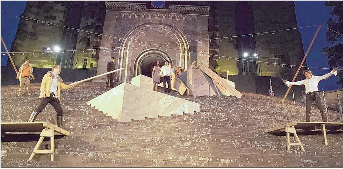
Vorne wird gehandelt und gekämpft: Romeo (Tobias Voigt, links) schlägt sich mit Tybalt (Jannek Petri). Das Duell mündet in eine der brutalsten Szenen einer ausgesprochen gewaltbereiten Inszenierung.

FREILICHTSPIELE / Saison auf der Treppe am Samstag eröffnet